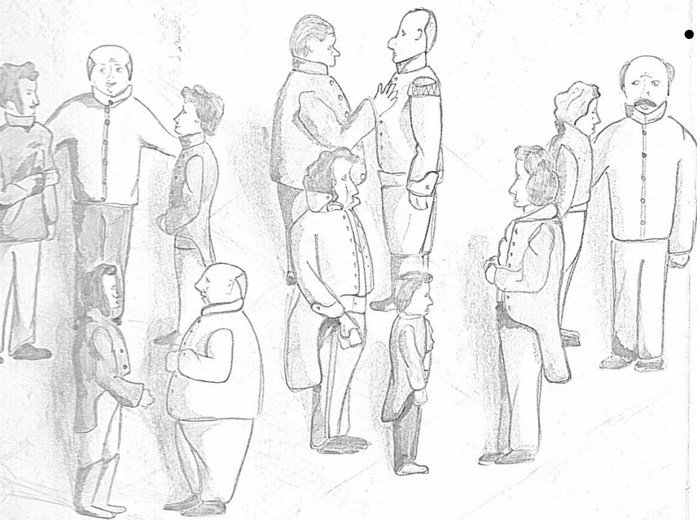
Глицыцк Антон, 15 лет.